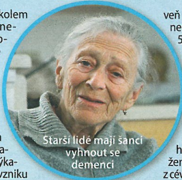
Starší lidé mají šanci vyhnout se demenci

Klinická studie SYST-EUR potvrdila, že více než dvouleté užívání léku, který obsahuje